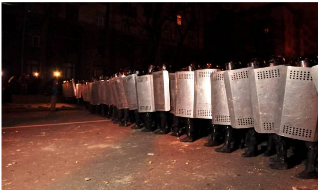
Oddziały żołnierzy sił wewnętrznych blokują ulicę wiodącą do siedziby prezydenta, 01.12.2013

Według danych organizacji Reporters Without Borders, która walczy o prawa dla przedstawicieli prasy, w związku z gwałtownym wzrostem ilości ataków na dziennikarzy w 2013 roku, Ukraina została uznana za najgorszy kraj w Europie pod względem możliwości wykonywania pracy przez dziennikarzy. Ze 120 faktów stosowania przemocy fizycznej, w 45 przypadkach ataku dokonywali przedstawiciele organów ścigania [9].