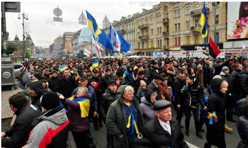
Uczestnicy Ogólnonarodowego Zgromadzenia maszerują ulicą Chreszczatyk na plac Niepodległości, 01.12.2013

01.12.2013 o godzinie 12.00 rozpoczęła się jedna z najbardziej masowych w historii niepodległej Ukrainy akcja protestu obywatelskiego, w której wzięło udział, według różnych ocen, od 500 do 700 tysięcy osób . Wielotysięczna kolumna protestujących zaczęła iść głównymi ulicami Kijowa. Do kolumny dołączyli europejscy dyplomaci, wiceprzewodniczący Europarlamentu Jacek Protasiewicz, były przewodniczący Europarlamentu Jerzy Buzek, były szef polskiego rządu Jarosław Kaczyński. Ogólnoukraiński strajk ogłosiła Konfederacja wolnych związków zawodowych Ukrainy. Masowe akcje protestacyjne odbyły się też w innych miastach: we Lwowie na ulice wyszło 40 tysięcy osób, w Łucku (Lutsk) – 8 tysięcy, w Czerniowcach (Chernivtsi) – 5 tysięcy, w Charkowie (Kharkiv) – 2 tysiące, w Dniepropietrowsku – tysiąc osób [1] .