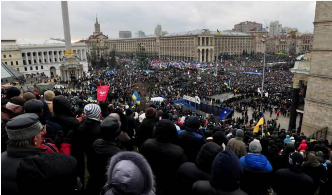
Ogólnonarodowe Zgromadzenie na placu Niepodległości, 01.12.2013

wewnętrznych Vitaliya Zakharchenko). Politycy wezwali demonstrantów do ogólnoukraińskiego strajku i blokowania dzielnicy rządowej bez użycia siły.