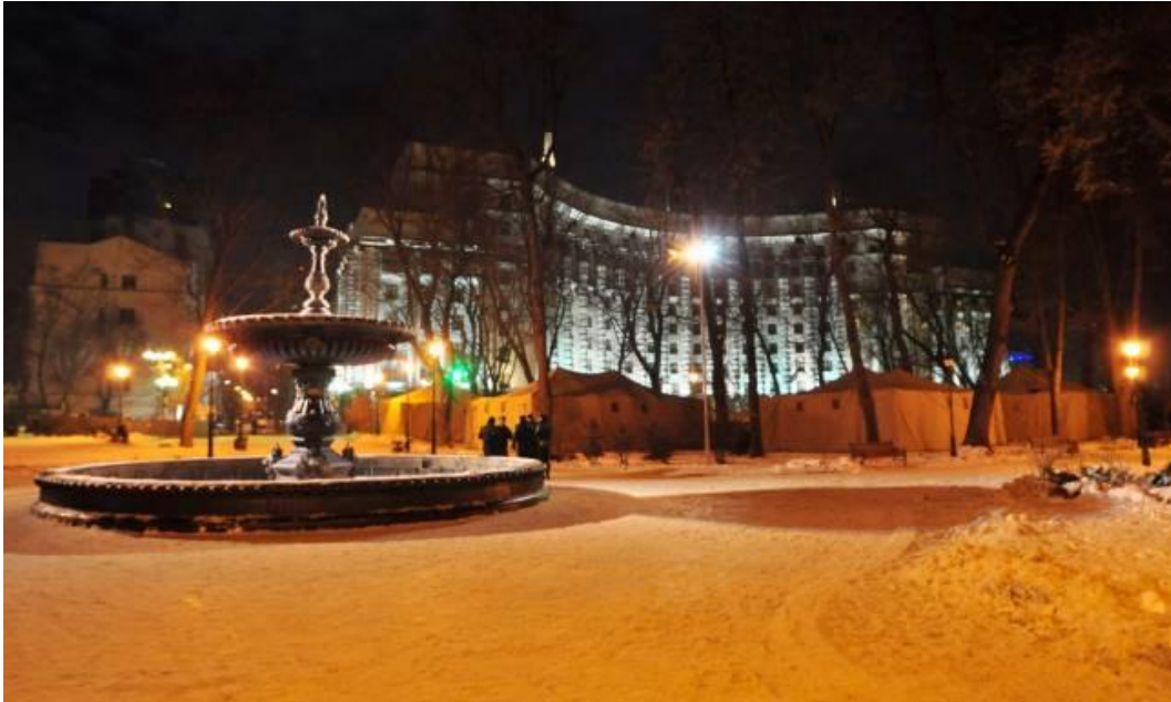
Namioty zwolenników Viktora Yanukovycha obok budynku rządu Ukrainy, 14.12.2013

22.12.2013 około 80 uczestników wiecu popierającego prezydenta, piketowało przed biurem proprezydenckiej partii, żądając wypłacenia im obiecane „wynagrodzenia” za udział w akcjach protestacyjnych [11].