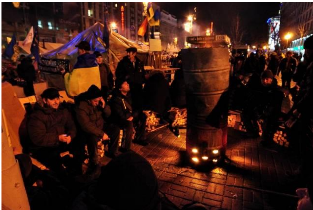
Noc na placu Niepodległości, 15.12.2013