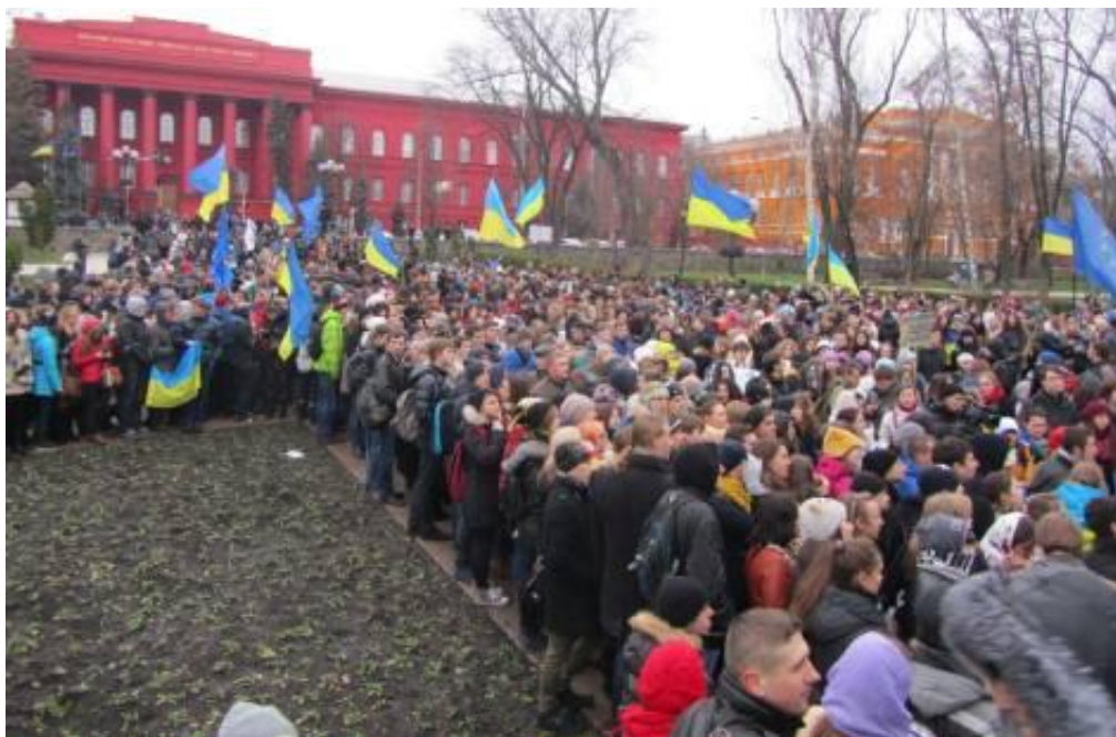
Strajk studentów, 26.11.2013

26.11.2013 studenci dwóch prestiżowych uczelni wyższych – Kijowsko-Mohylańskiej Akademii i Uniwersytetu im. Tarasa Szewczenko – ogłosili strajk studencki i kolumną składającą się z 3 tysięcy osób przeszli głównymi ulicami na plac Niepodległości, domagając się podpisania umowy o stowarzyszeniu z UE. Wkrótce do strajku dołączyli też studenci z innych uniwersytetów: Politechniki Kijowskiej, Uniwersytetu Medycznego im. Bohomolca, Uniwersytetu Pedagogicznego im. Dragomanova [1].