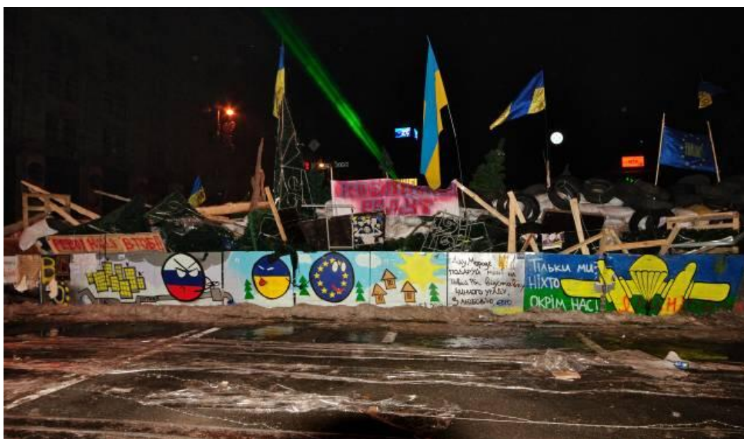
Barykady na placu Niepodległości, 15.12.2013