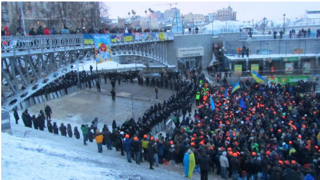
Rano 11.12.2013. Plac Niepodległości.

W wyniku przeprowadzonego szturm na placu Niepodległości rannych zostało 30 osób, z których 15 zostało hospitalizowanych z powodu różnego rodzaju obrażeń, między innymi, urazów czaszkowo-mózgowymi, stłuczeń, złamań [25]. Wśród poszkodowanych znaleźli się też ukraińscy deputowani, między innymi przedstawiciel partii „Svoboda” Andrey Illenko [26]. Do Szewczenkowskiej Komendy Rejonowej Milicji doprowadzonych zostało 8 demonstrantów, którzy po ich przesłuchaniu i sporządzeniu protokołu wykroczenia z artykułu 173 ukraińskiego kodeksu wykroczeń (drobne chuligaństwo) zostali zwolnieni.