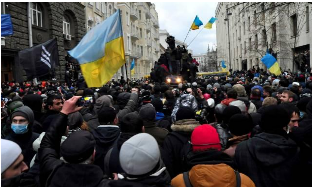
Akcja protestacyjna obok siedziby prezydenta Ukrainy, 01.12.2013

01.12.2013 około godziny 14.00 grupa młodych ludzi, przeważnie zamaskowanych, rozpoczęła szturm na budynek siedziby prezydenta. Za nimi zebrali się kilka tysięcy pokojowych demonstrantów. Przed budynkiem siedziby prezydenta ustawili się żołnierze wojsk wewnętrznych MSW. Nieznane osoby przyprowadziły spychacz [3], którym próbowano staranować żołnierzy [4]. Niektórzy z demonstrantów zaczęli atakować żołnierzy MSW bijąc ich pałkami i łomami oraz rzucając w nich petardami, kamieniami, butelkami z koktajlem Mołotowa. Żołnierze MSW stali w charakterze żywej tarczy i nie podejmowali żadnych działań. Wśród demonstrantów byli też tacy, którzy zasłaniali sobą żołnierzy, próbując w ten sposób powstrzymać innych działaczy siłowych.