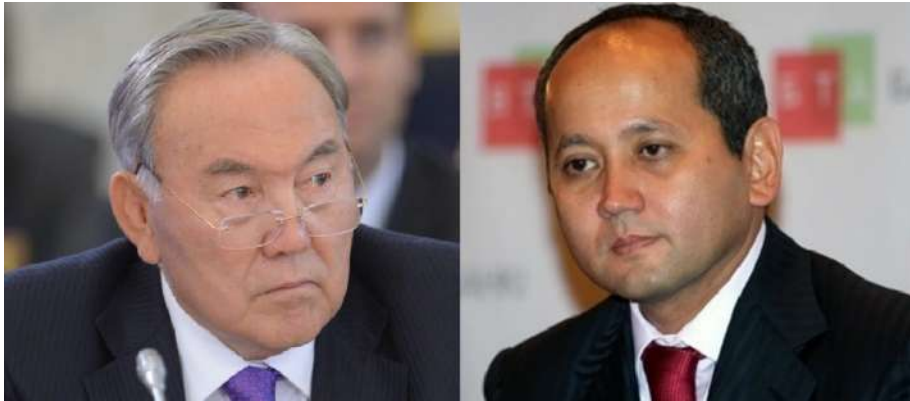
Nursultan Nazarbayev i Mukhtar Ablyazov.